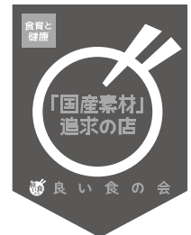
プレミアムフラッグ (国産素材追求の店)

※お申し込みに関する審査等は一切ございません。内容については店舗さまの自己責任でお願いします。