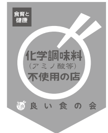
プレミアムフラッグ (化学調味料不使用の店)